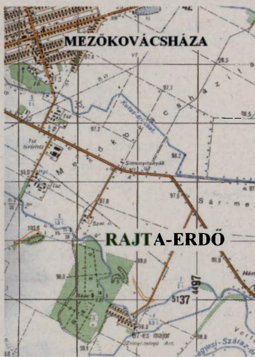
A Rajta-erdő és városunk elhelyezkedése

A Rajta-erdő szerencsére nem szűkölködik gyógynövényekben, hiszen több fajt felfedezhet a szemfüles túrázó. A Rajta-erdő telepített, legjobb tudomásunk szerint Mária Terézia óta. Az elődök gondoskodtak a helyes erdőművelésről, minek eredményeként fokozatos volt a felújítás, és elegyfák is kerültek a kocsányos tölgyek közé. Az erdő nagy részén kocsányos tölgyeket találunk. Az erdészeti utak, és a Szárazér, valamint nedvesebb foltok mentén idős példányokat meghagytak, a legnagyobb kerülete mellmagasságban mérve 430 cm, valamivel kisebbekből több példány is van. Megfigyelhetjük, hogy helyenként szil, kőris, mezei juhar és vadvadkörte keveredik, de példányszámuk elenyésző. A cserjék közül az erdőszéleken tömeges a kökény a fagyal, csikos kecskerágó, egybibés galagonya, gyepű / =vad / rózsa és veresgyűrűs som csekély mennyiségben fordul elő. Sajnos több tájidegen faj telepedett meg és gyarapodik a madarak és az ember munkálkodása nyomán: az agresszíven terjedő zöld juhar, bálványfa, ostorfa, ezüstfa / „olajfa” /, a hóbogyó, és az amerikai vadszőlő. Az erdő több mint felét ültetett akác / bodzával / foglalja el.