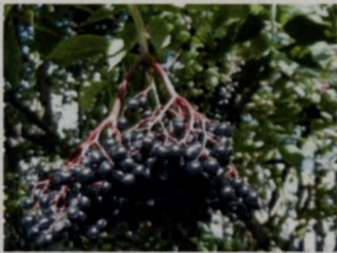
A fekete bodza termése

A bodzatea köptető, veseműködést szabályzó, izzasztó hatású. A virágából készült tea megfázásnál izzasztó és köptető hatású. Mandula- és torokgyulladás ellen régen tejjel leforrázva ajánlották. Hatása összetett, hisz vérnyomáscsökkentő, nyugtató, vértisztító enyhe hashajtó hatású, veseműködést szabályzó gyógyteákban is megtalálható. A gyümölcs főzetével a görcsszerű fejfájást gyógyítják.