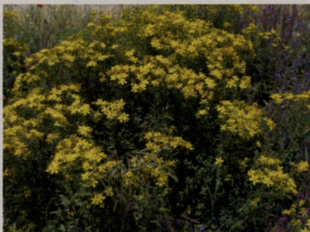
Orbáncfű, ligeti zsályával körülveve

Ez erdő széli területeken megfigyelhettem néhány orbáncfű tövet is. Könnyen felismerhető lyukacsos leveléről és júliustól szeptemberig nyíló sárga virágairól is. Különleges tulajdonsága ennek a növénynek, hogy virágát szétmorzsolva piros levet ereszt. Az orbáncfű szintén remek sebolaj, fájdalomcsillapító, gyulladásgátló hatása van. Alkalmazzák idegsérülések, zúzódások esetén valamint olyankor is ha valaki megemeli magát és ebből fakadó panaszai vannak. A legjobb természetes orvosság az idegbántalmak esetén, neurózisok, álmatlanság, beszédzavar, ágybavizelés, hisztérikus rohamok és holdkórosság ellen, valamint korunk egyik gyakori stressz okozta betegsége a depresszió ellen. A felsorolt bajok esetén ülőfürdő és lábfürdő is javallott. Fiatal lányoknak segít beszabályozni a havi ciklus rendszerességét, viszont egyres mai fogamzásgátló szerek mellett a fogyasztása nem ajánlott.