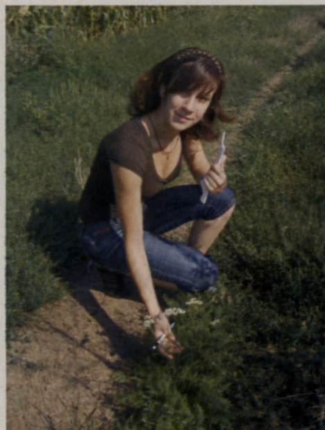
A cickafarkfű az út mentén is nő

Ez a gyógynövény szintén sok súlyos betegségen segíthet, de a nők számára a legértékesebb. Mindegy, hogy fiatal lányról van szó, aki esetleg rendszertelenül menstruál, vagy idősebb nő, aki épp a változókorban van, ugyanis a cickafarkfű-tea kedvezően befolyásolja a női medence szerveit. Petefészekgyulladásnál az ülőfürdő már gyakran az első alkalommal megszünteti a fájdalmat, és a gyulladást is fokozatosan csökkenti. A miomát is megszünteti a cickafark-ülőfürdő, lemosással megszüntethető a hüvelyviszketés. A végtagokban jelentkező ideggyulladás esetén is hatásosan alkalmazható a fürdő. Migrénes fejfájás kezelésekként remekül beválik a cickafarkfű-tea. A cickafarkfű közvetlenül és nagymértékben hat a csontvelőre és így fokozza a vérképződést, valamint vértisztító hatása révén évek óta lappangó betegségeket is képes elűzni. Tüdővérzés, gyomorvérzés, vérző aranyér, erős gyomorégés, gyomornyomás esetén is javulást okoz a teája. Forró cickafarkfű-tea javasolt meghűlés, hát- és reumatikus fájás esetén. Szabályozza a veseműködést, megszünteti az étvágytalanságot, elmulasztja a gyomorgörcsöket, a puffadást, a máj zavarait, fokozza a bélbolyhok tevékenységét, így segíti a rendszeres székletürítést. Keringési zavarok, érgörcsök ellen is igen hatásos.