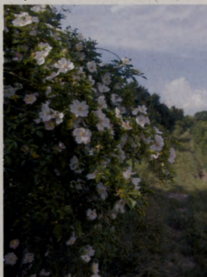
Virágzó csipkebogyóbokor az út szélén

Ha valaki meghallja a csipkebogyó szót egyből a C-vitamin jut az eszébe, de ez teljesen érthető, hiszen C-vitamin tartalma tízszer nagyobb a citroménál. A gyepűrózsa bogyója a C-vitaminon kívül számos olyan anyagot tartalmaz, amelyet az emberi szervezet kiválóan tud hasznosítani: pektin, flavonoidok, cukor, alma- és citromsav, cseranyag, A vitamin. Már az ókori népek is felismerték gyógyító hatását, főként a sorvadásos betegségek ellen. A C-vitamin fokozza a szervezet ellenálló-képességét, a flavonoidok gyulladásgátló és antibiotikus immunerősítő hatást fejtenek ki, a pektinek pedig segítik az emésztést. A bogyóból készített gyógytea influenzás időszakban, megfűléses megbetegedések idején rendszeresen fogyasztandó. Ismeretes gyógyhatása vese- és hólyagbántalmakra, bélhurut és hörghurut esetén. Emésztést javító hatása közismert, gyenge vizelethajtó tulajdonságú. A csipkebogyó készítmények jól használhatók erősítő, üdítő és élvezeti célokra is. Ízjavító hatása miatt gyógynövény-keverékekben, gyümölcs-teákban széles körben alkalmazzák.