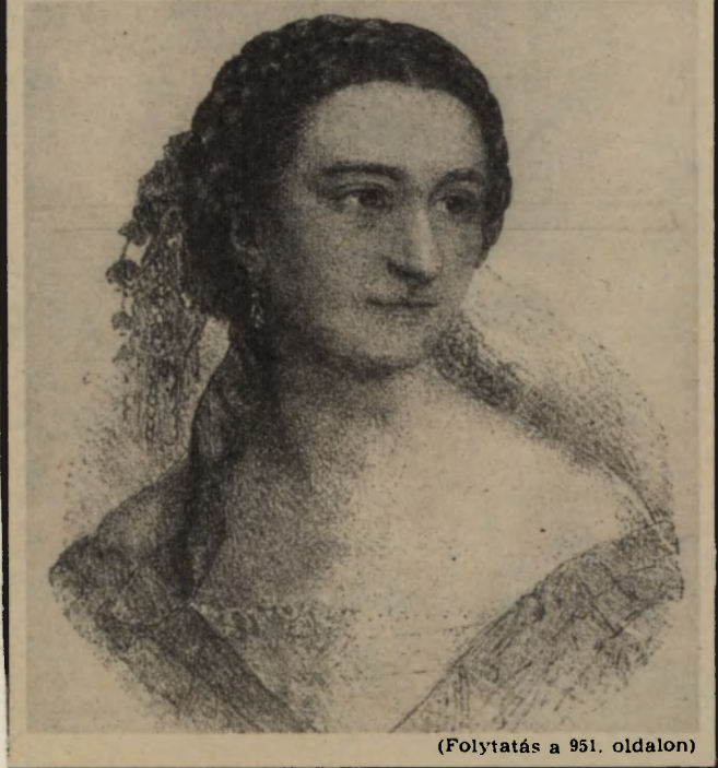
(Folytatás a 951. oldalon)